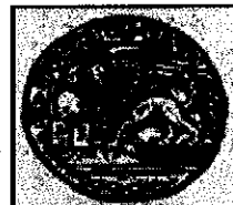
Azienda Ulss 12 Veneziana