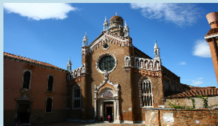
Chiesa della Madonna Dell'Orto. A fianco, la Scuola dei Mercanti.

Da lì, il percorso fino alla Sede è di circa 5 - 7 minuti a piedi.